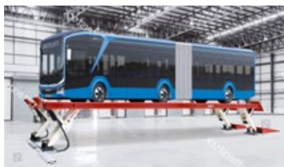
Maximální délka plošiny 14.5 m