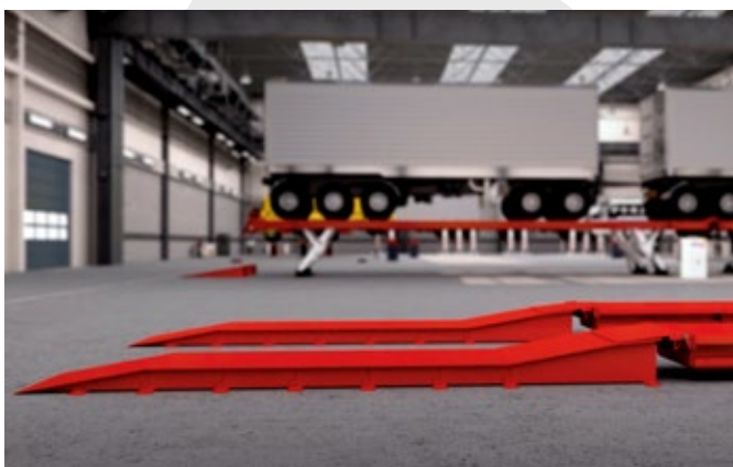
Modulární nájezdy a prodloužení