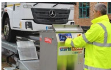
Ovládací box v nerez