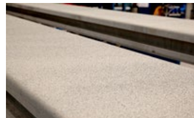
Stertil® Guard™ protiskluzová úprava