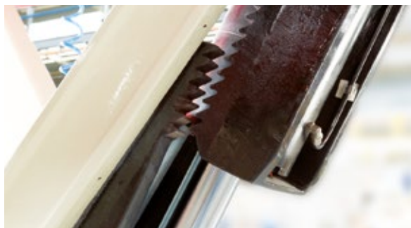
Mechanický západkový systém

Mechanik může pracovat ergonomicky a bezpečně stát vzpřímeně pod vozidlem. Pod plošinou může mít vozík s nářadím a další vybavení.