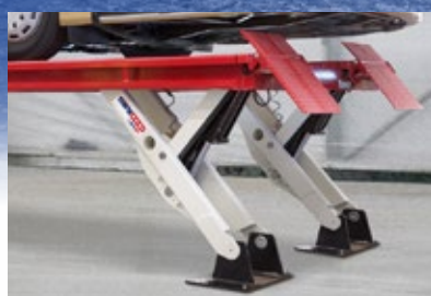
Výborný přístup - konstrukce nohou ve tvaru Y