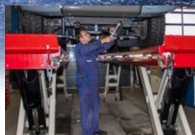
Maximální přístup k vozidlu