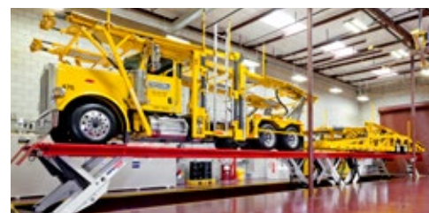
Velká flexibilita pro velmi dlouhá vozidla