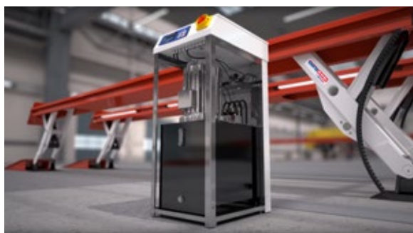
Jednoduchá údržba ovládacího boxu - odnímatelné stěny.