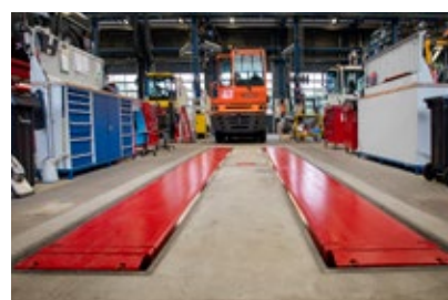
Zvedák zapuštěný do podlahy s ochranou ROLL-OFF

Bezpečnost je u Stertil-Koni jednou z priorit. Automatická zábrana systému Roll-Off zabrání neúmyslnému sjetí vozidla z plošin. Option .