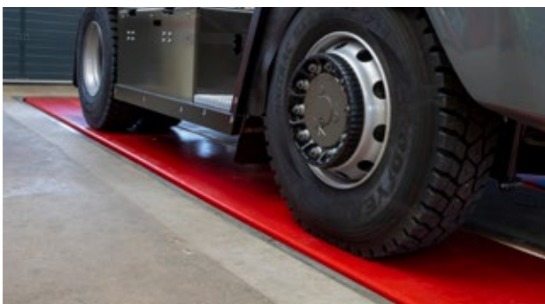
Zapuštění ideální pro nízkopodlažní vozidla

Zapuštěný do podlahy, částečně zapuštěný, na podlaze - možnosti instalace zvedáku SKYLIFT. Vhodný pro široký rozsah vozidel a potřeby dílny.