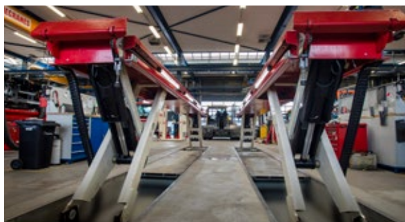
Automatický kryt vybrání