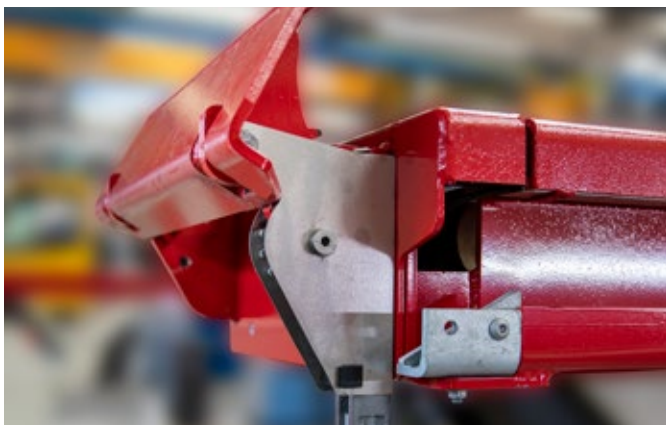
Systém Roll-Off proti sjetí