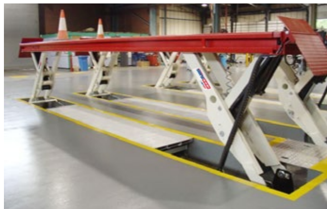
Automatické krycí plechy