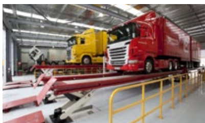
Různé délky plošin

Vybavena speciální synchronizací a přemostěním mezi dvěma zvedáky, umožňující bezpečné a rychlé použití dvou zvedáků SKYLIFT jako jeden dlouhý zvedák nebo dva samostatné individuální zvedáky. Najíždění je stejně bezpečné jako u samostatného zvedáku. Je to dáno minimální mezerou mezi oběma zvedáky.