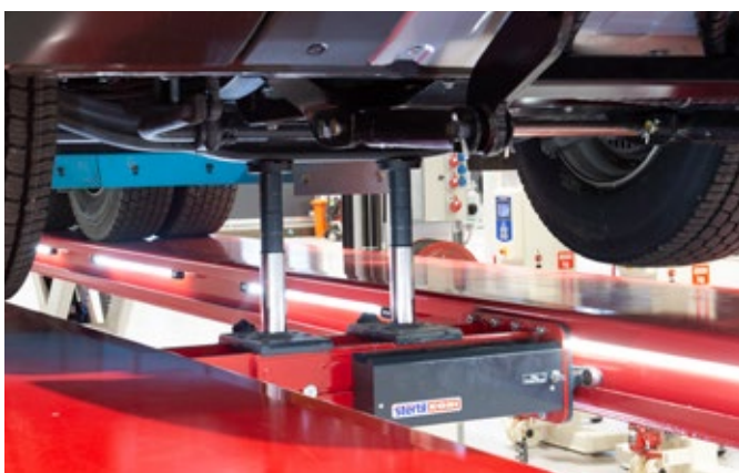
Pomocný nápravový přízved