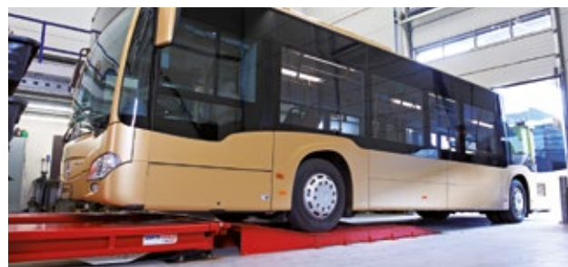
Varianta jednosměrné se STOP plechy nebo průjezdné